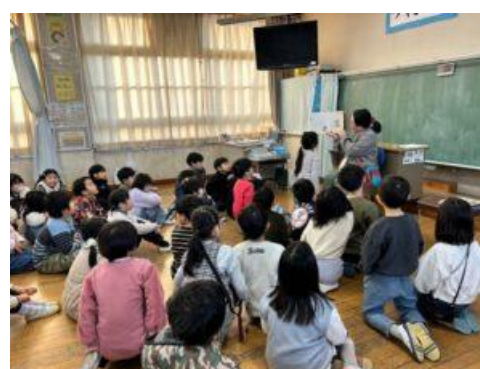
(かすがっ子おはなし会)